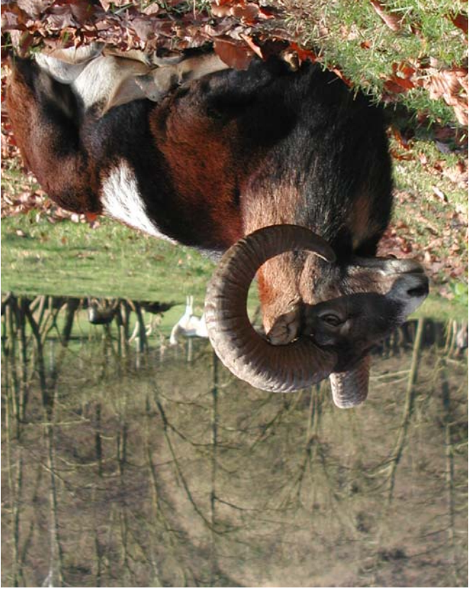
Muffelwider im Dezember 2006

Im September 2003 wurden 3 Stück Muffelwild eingesetzt, ein Widder und zwei Schafe. Der Widder erhielt den markanten Namen "Uch von Büdingen". Das erste Lamm kam am 3. April 2004 zur Welt. Es erhielt den Namen Paul Moses, weil das Mutterschaf es nicht annahm, und mußte von Mitleidern des Förstersgezogen werden. Mittlerweile hat sich eine kleine aber stabile Muffelwildherde gebildet.