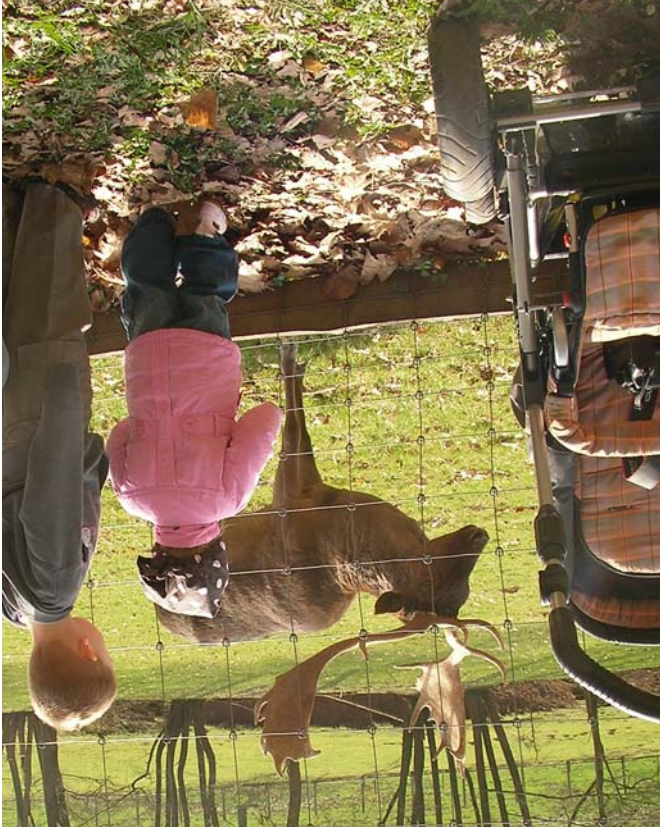
Der Wildpark ist das erste Ausflugsziel im Frühjahr